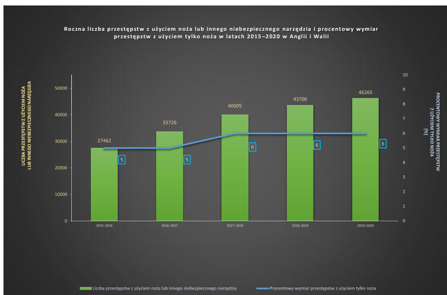
Wykres 1. Roczna liczba przestępstw z użyciem noża lub innego niebezpiecznego narzędzia i procentowy wymiar przestępstw z użyciem tylko noża w latach 2015–2020 w Anglii i Walii

odnotowano 27 462 przestępstw, a w 2019–2020 było ich aż 46 265. W odniesieniu do procentowego wymiaru przestępstw z użyciem noża, zauważalna jest tendencja utrzymywania się na tym samym poziomie (6%) od 2016–2017, co stanowiło 1% ięcej zarejestrowanych przypadków niż w okresie poprzedzającym. Niepokojący jest zarówno ogólny, jak i procentowy wzrost tego rodzaju zarejestrowanych przestępstw, ponieważ oznacza to, że zastosowane sposoby zwalczania zjawiska okazują się mało skuteczne, o czym będzie mowa w dalszej części rozważań. Wyżej wymienione wartości zaprezentowano również w formie wykresu.